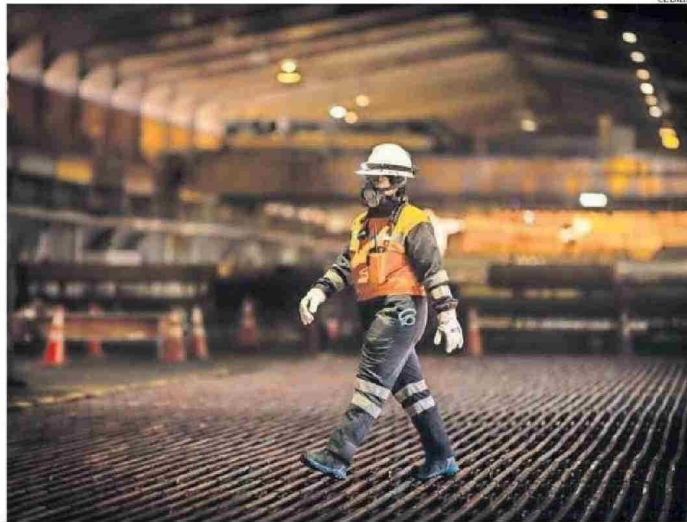
EL PROYECTO SE PRESENTÓ EL 28 DE JUNIO 2023 Y TUVO UNA RÁPIDA EVALUACIÓN EN EL SEA DE 687 DÍAS TOTALES.

La aprobación, que es parte de un proceso que consideró dos procesos de Participación Ciudadana (PAC) y una Consulta Indígena, permite extender la operación desde junio de 2025 hasta diciembre de 2051, manteniendo la actual tasa de extracción de materiales de la mina de 260.000 toneladas por día y una tasa de producción de 176.000 toneladas por año; conforme a lo autorizado en el proyecto original.