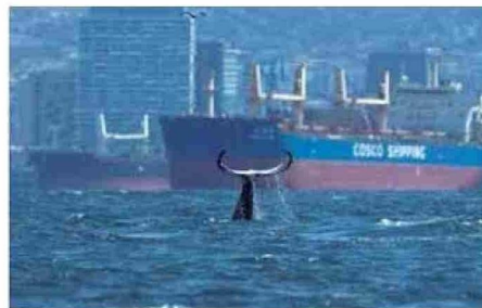
EXPERTA ENTREGA CONSEJOS PARA EVITAR ACCIDENTES EN EL MAR.

ma, reducir la velocidad y navegar de manera predecible. Si el animal está muy cerca, se recomienda poner el motor en neutro y dejar que sea la ballena la que se aleje", indica, y recuerda que la normativa vigente establece una distancia mínima de 100 metros.