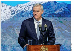
El Presidente expuso en el seminario Latam Focus, organizado por BTG Pactual.

Más tarde, en el Hotel W, el mandatario criticó fuertemente la reforma tributaria de Bachelet, a quien culpó del bajo crecimiento. En el equipo del Presidente descartó que el relato tenga relación