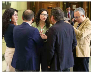
Los jefes de bancada del FA, PC y PS se reunieron ayer en el Congreso para abordar el ingreso de la propuesta.

Estos temas serán abordados durante la jornada de hoy en una reunión de presidentes de partidos en la sede del PS.