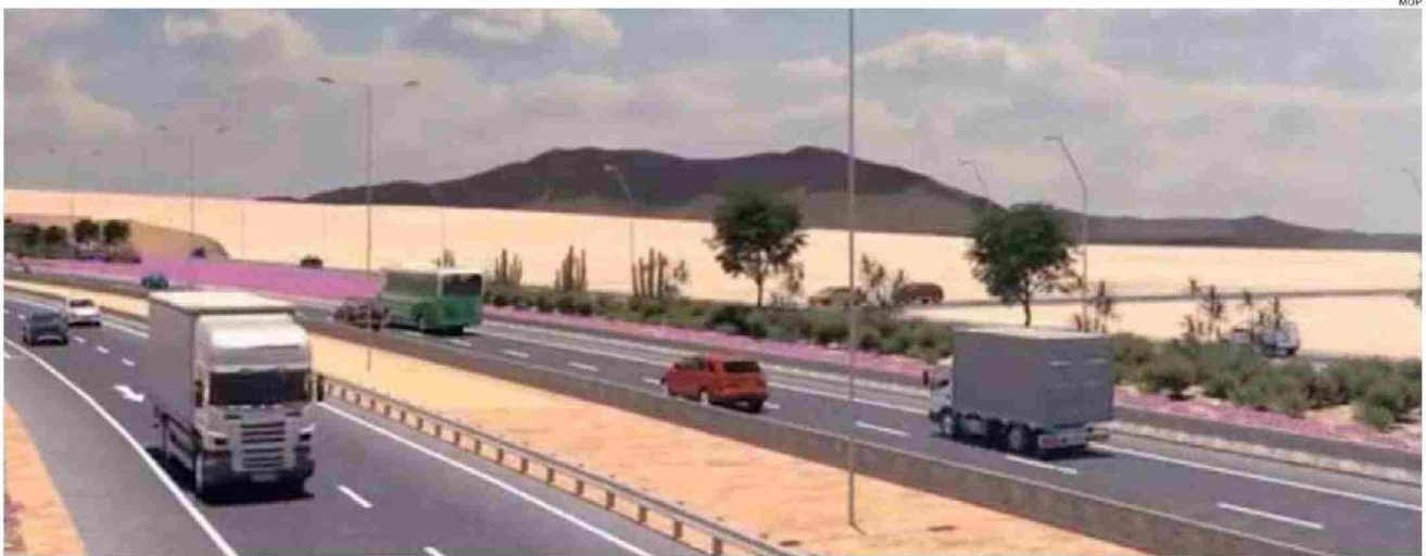
LA INICIATIVA PERMITIRÁ AMPLIAR 466 KM CON DOBLE CALZADA POR SENTIDO.