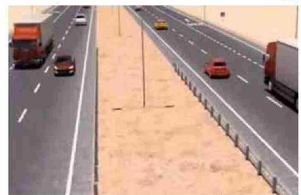
MEJORARÁ LAS CONDICIONES DE SEGURIDAD DE LA VÍA.

OBRAS PÚBLICAS. La recepción de las ofertas técnicas y económicas del proyecto se concretará el 25 de abril de 2025, para luego dar paso a la apertura económica el 23 de mayo de 2025. Considera cinco sectores que van desde el acceso sur a Chañaral hasta el sector "La Negra" en Antofagasta.