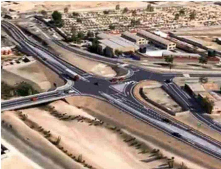
PERMITIRÍA UNA MAYOR ACTIVIDAD PRODUCTIVA Y ECONÓMICA.

ministra López en torno al llamado a licitación del proyecto de la doble vía Caldera-Antofagasta, es un proyecto muy anhelado y esperado por la Región de Atacama y sus usuarios, que considera toda las variables que hemos ido trabajando en el tiempo, en torno a la participación ciudadana, sobre todo de las comunas de Chañaral y los alrededores y esperamos que esta licitación ocurra en tiempo y en espacio y tengamos en el mes de abril, ya la recepción de oferta y en el mes de mayo del 2025 la apertura económica. Por lo cual estamos muy contentos y optimistas con esta gran iniciativa que le dará seguridad a todos aquellos quienes utilizan nuestras carreteras, sobre todo a la actividad productiva y económica que nos merecemos como Región de Atacama”.