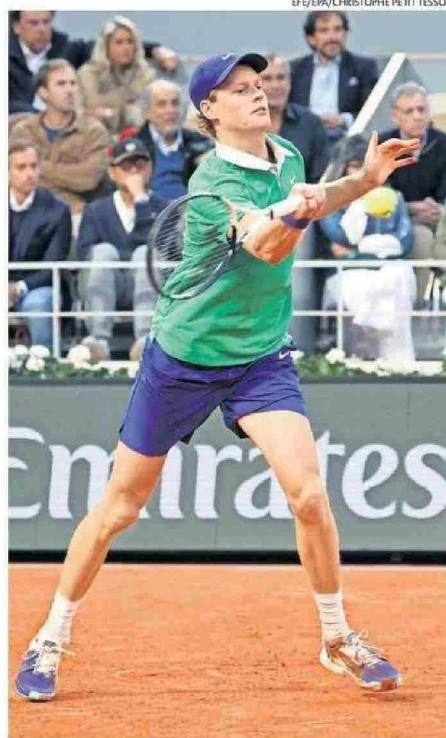
EL ITALIANO LLEGA A LA FINAL SIN CEDER SETS EN PARÍS.