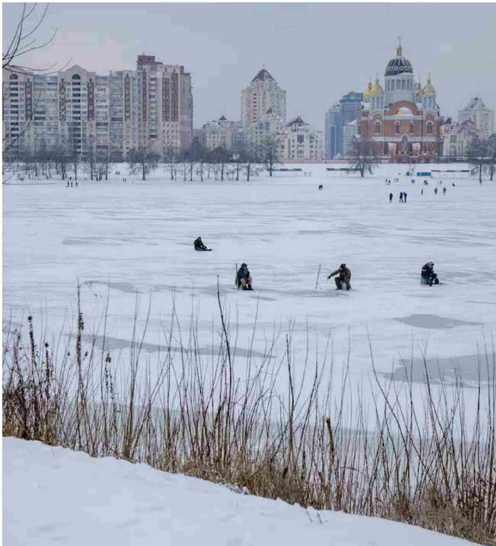
► Hombres pescan en un lago congelado, en un frío día de invierno en un barrio de Kiev, Ucrania, el 11 de enero.

Las autoridades ucranianas han descrito los recientes ataques de Rusia como un "invierno instrumental". El presidente Volodymyr Zelensky declaró estado de emergencia en el sector energético, con especial atención a la capital ucraniana.