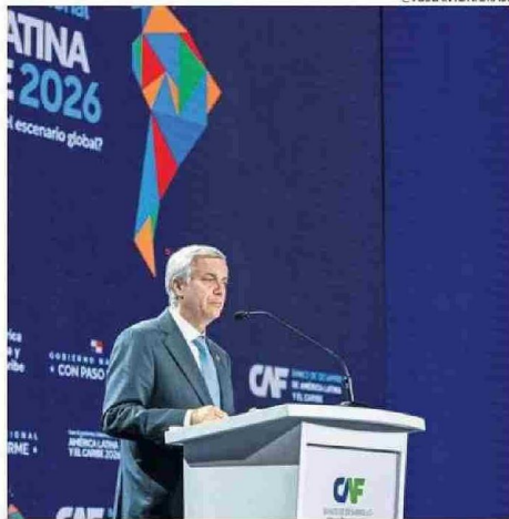
KAST INVITÓ A LOS MANDATARIOS ASISTENTES AL CAMBIO DE MANDO.

En la situación de América Latina no admite eufemismos. Nuestra región no ha estado parada, ha estado estancada por falta de ideas, ha estado parada en muchos lugares por falta de carácter", millones de latinoamericanos siguen atrapados en la pobreza, en la inseguridad, en la falta de empleo. Y eso no ayuda a la academia, ni al fracaso político",