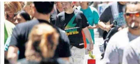
SE ESPERA QUE EN 2070 LA POBLACIÓN DEL PAÍS SEA DE 16.972.558.

Por X. Lula contó que abordaron "la necesidad de promover la estabilidad regional, fortalecer la seguridad pública e intensificar las acciones conjuntas para combatir el crimen organizado, reconociendo la importancia de la cooperación para enfrentar desafíos comunes". Agregó que espera una cita de cancilleres en los próximos meses. ★