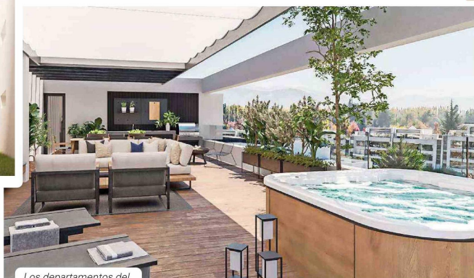
Los departamentos del último piso de El Avellano poseen quincho y jacuzzi en terrazas privadas.

“Actualmente, El Avellano se encuentra en etapa de venta y está pensado principalmente