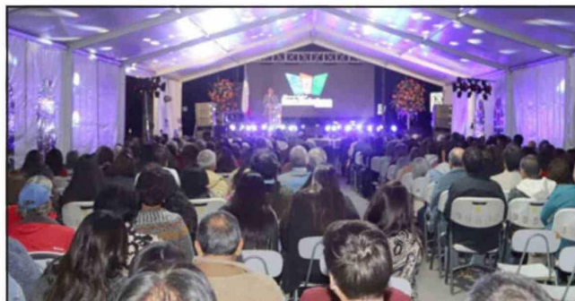
La ceremonia se realizó junto a autoridades, vecinos y dirigentes.