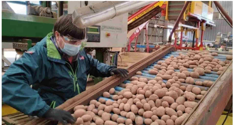
PARA FORMAR UNA INDUSTRIA procesadora de papa en Chile, los productores piden mejores instrumentos financieros y bancarios.

Respecto de este punto, Miquel agregó que "todavía podríamos sacarle muchísimo