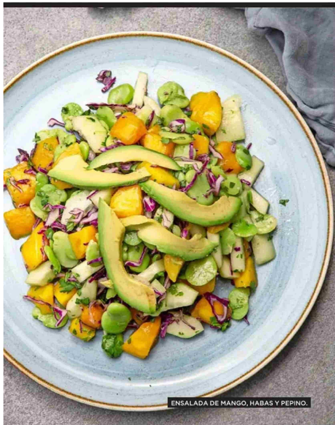
ENSALADA DE MANGO, HABAS Y PEPINO.

Tiraje: 126.654 Lectoría: 320.543 Favorabilidad: No Definida