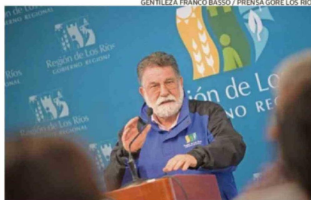
EL GOBERNADOR REGIONAL LUIS CUVERTINO.

También, dijo: “Lo único que tenemos hoy de certeza es reducción de presupuestos y aumento de costos. Por eso nuestro llamado desde el municipio de Valdivia es que la crisis no la podemos sortear con los bolsillos subnacionales, que al contrario, son los que deben ser reforzados para poder llegar a nuestros vecinos y vecinas. La tarea es ardua. La cons-