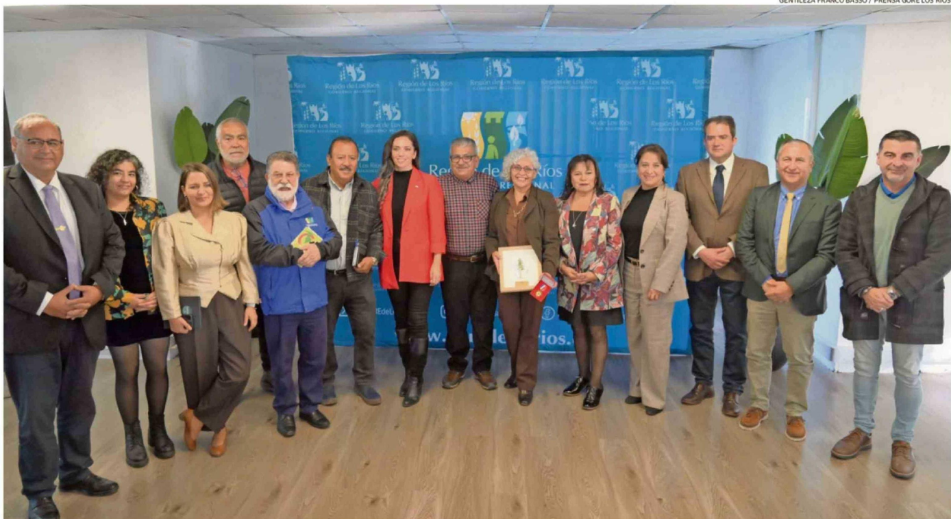
LA ACTIVIDAD CONVOCADA POR EL GORE SE REALIZÓ EN DEPENDENCIAS DE NUBE COWORK EN LA ISLA TEJA, CON ASISTENCIA DE DIFERENTES AUTORIDADES Y DE LA COMUNIDAD EN GENERAL.