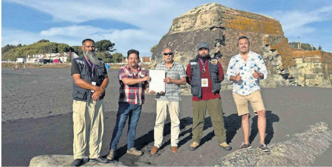
El Cabildo Patrimonial de Coronel gestó la postulación al Consejo de Monumentos Nacionales.