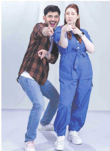
Rostros. El canal potencia a nuevos animadores.