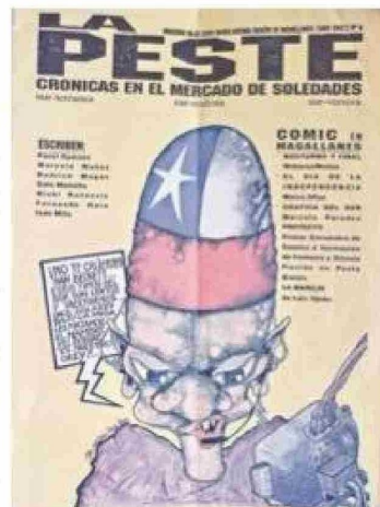
Ultimo número de "La Peste", publicado en el invierno de 1997.

De inmediato se advertía que no se trataba de un producto cualquiera. Su propuesta estética recordaba producciones del comic argentino o de revistas underground chilenas como "Matucana", "Beso Negro", "Acido" y de contenidos que aludían a los primeros números de "La Bicileta".