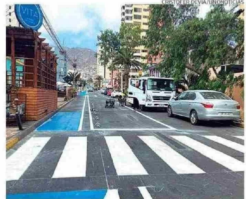
HABILITACIÓN DE NUEVA CICLOVÍA EN CALLE SALVADOR REYES.

contaba con tanto tráfico de vehículo. La tranquilidad habitual de la zona, pero ningún ciclista a la vista.