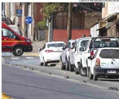
VEHÍCULOS ESTACIONADOS EN LA CICLOVÍA DE CALLE MONTEVIDEO.