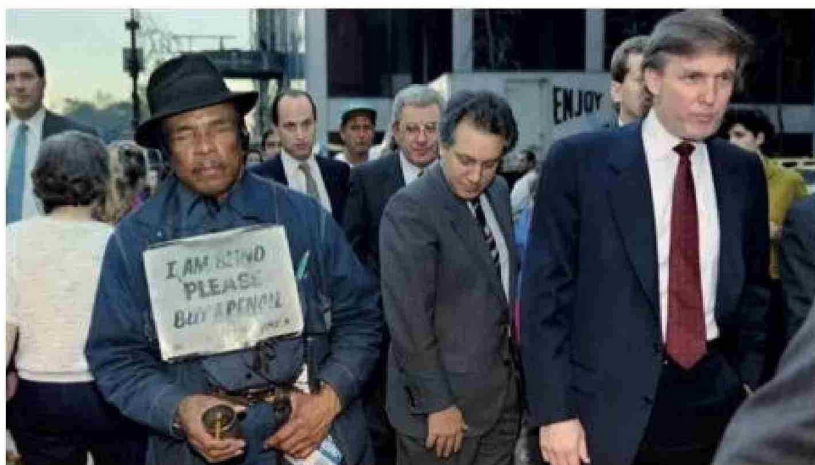
El actual presidente de EE.UU., Donald Trump, en 1990 hizo campaña para sacar a los mendigos e indigentes de la acaudalada Quinta Avenida de Nueva York.

"En 1970, en la ciudad de Omaha (Nebraska), un policía quería arrestar a una persona sin hogar, pero no tenía motivos, porque el hombre no mendigaba, no estaba borracho ni alteraba el orden público. Sin embargo, el