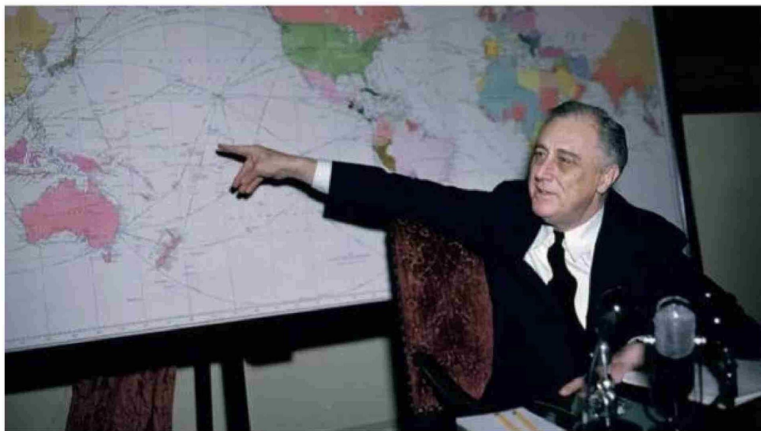
Expertos aseguran que las "leyes feas" no estaban dirigidas en contra de personas como el Presidente Roosevelt, a quien la polio dejó paralizado de la cintura para abajo, sino que fue un daño colateral.

ejemplo, preveía multas de un US$1 (más de US$20 hoy) por cada infracción a la "persona enferma, mutilada o deformada" que se expusiera en lugares públicos.