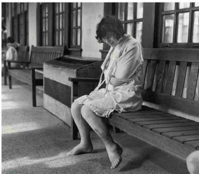
Los mendigos o discapacitados que violaban las prohibiciones de exponerse en lugares públicos se enfrentaban a multas o eran internados en hospicios, no siempre en buenas condiciones.