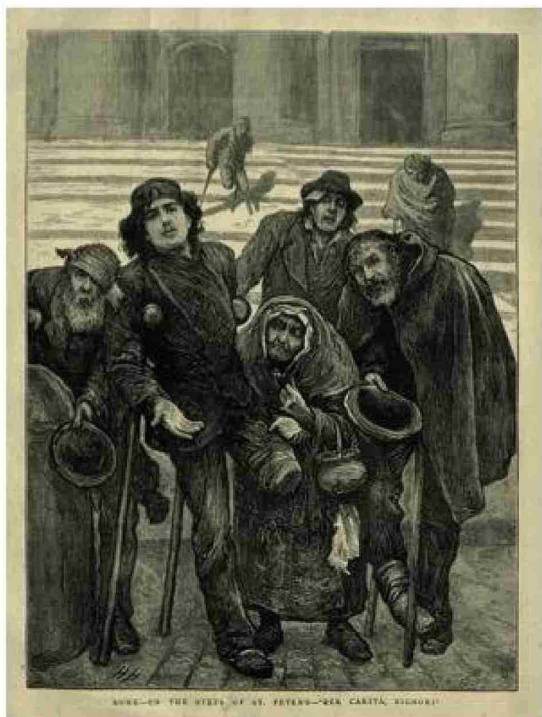
En el siglo XIX había la creencia de que las personas deformadas podían afectar la salud pública.