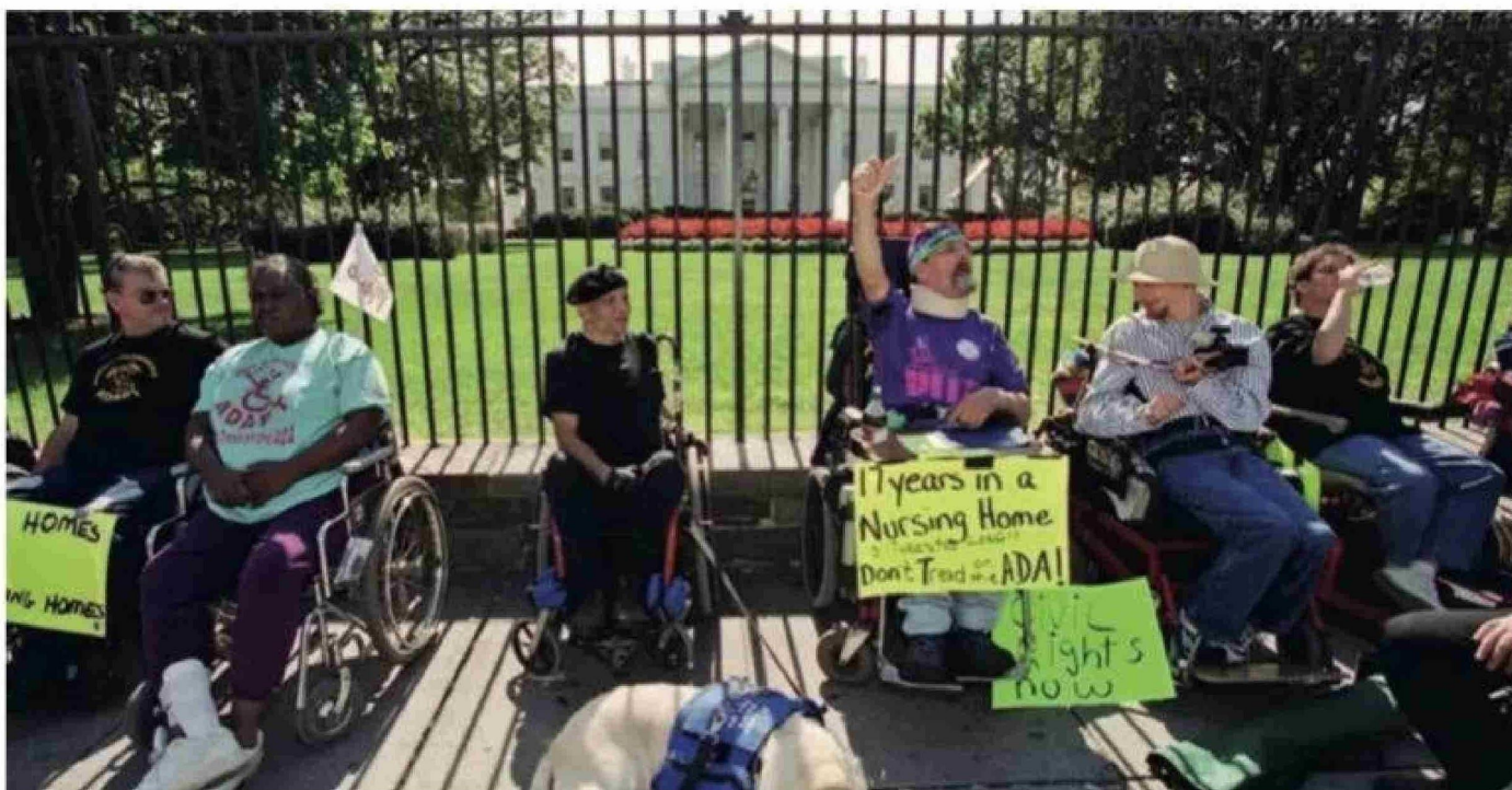
A partir de la década de 1970, el movimiento a favor de los derechos de las personas discapacitadas presionó para derogar las "leyes feas".

Título: se expusieron al público. "La consecuencia fue que las personas a las que se les aplicaron estas 'leyes' fueron obligadas a ingresar a asilos o casas de beneficencia. Y esto era una sentencia no oficial de cadena perpetua", aseguró Schweik.