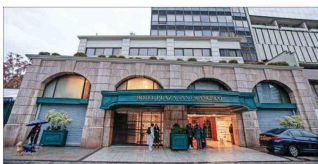
El Plaza San Francisco se ubica en la Alameda y ha acogido convenciones y deportistas.

"Tenemos que unirnos para que el evento deportivo más importante desde el Mundial del '62 sea una fiesta, en donde todos los visitantes se vayan hablando maravillas de Chile y dejar de lado al centro es no entender esta valiosa oportunidad".