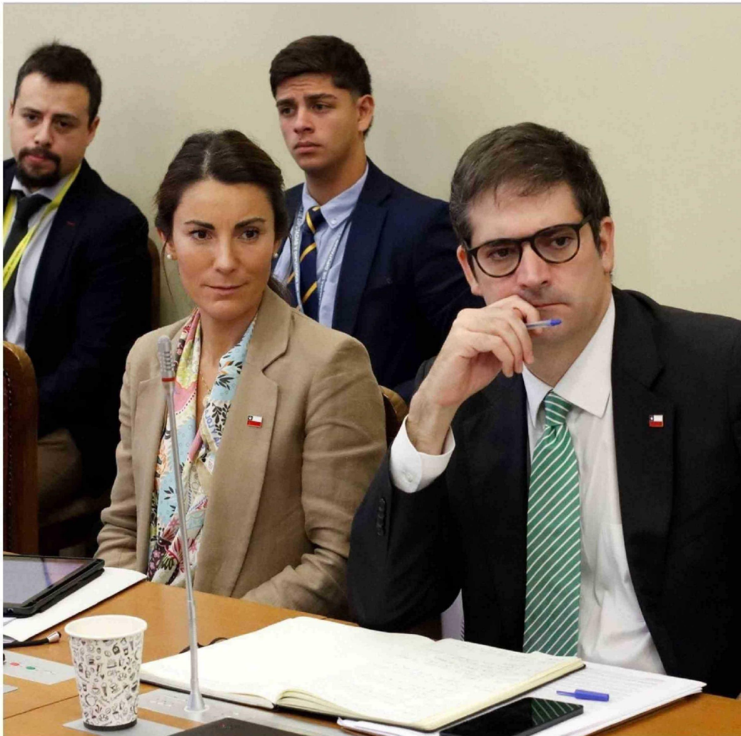
► La ministra María Paz Arzola y el subsecretario de Educación Daniel Rodríguez.

En el marco del ajuste fiscal mandatado por Hacienda la Dirección de Educación Pública entregó instrucciones financieras expresas a los Servicios Locales, poco antes de que se reactivara el debate por la intención del Ejecutivo de frenar la desmunicipalización escolar. Diputados de oposición acudirán a Contraloría por eventuales vulneraciones de autonomía.