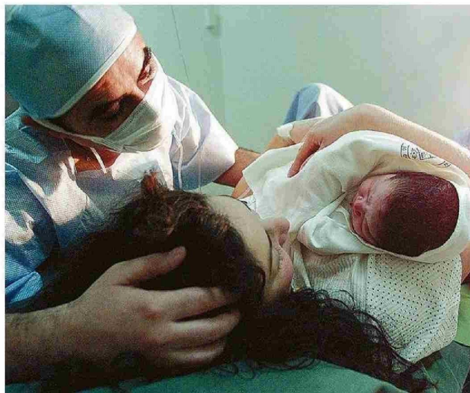
EXPERTOS REMARCARON LAS CONSECUENCIAS DE LA CAÍDA DE LA NATALIDAD EN EL TERRITORIO.

Frente a esto, remarcó que el Estado debe buscar soluciones para fortalecer la natalidad, remarcando que esto va a traer a la larga problemas en la fuerza de trabajo de la región y del país.