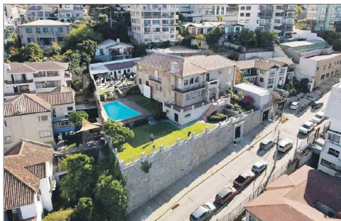
El centro de eventos está en Recreo y salió en la teleserie "Cerroalegre".