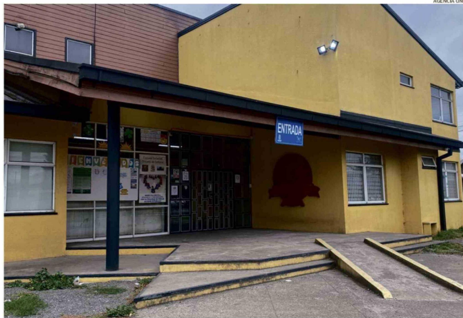
LA ESCUELA PERMANECIÓ CERRADA DURANTE LA TARDE DEL MARTES, YA QUE NO SE PUEDEN REALIZAR ACTIVIDADES HASTA EL PRÓXIMO LUNES.

"Muy sabiamente, no encendió luces ni manipuló ningún artefacto, y de inmediato se comunicó con las personas