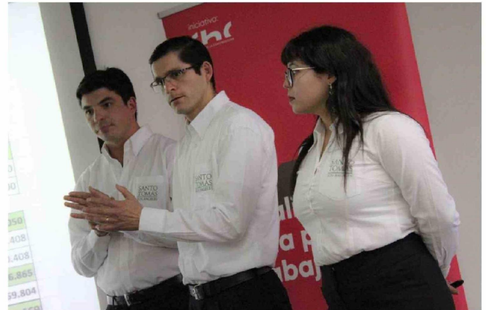
EL PLAZO DE POSTULACIÓN se extendió hasta el 24 de mayo próximo.

Esto está aperturado para todas las disciplinas, no es excluyente para el área de construcción, sino específicamente, está aperturado para estudiantes de educación superior con un alcance nacional.