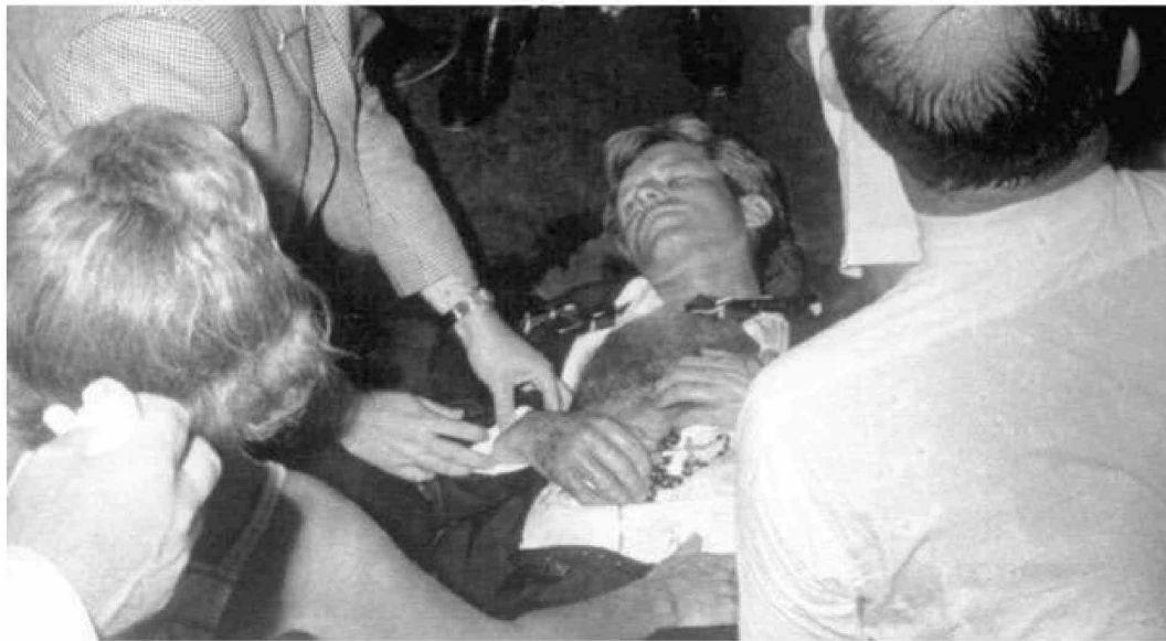
Robert Kennedy en el suelo tras recibir los disparos.

Había casos que parecían probar la existencia de esos ase-