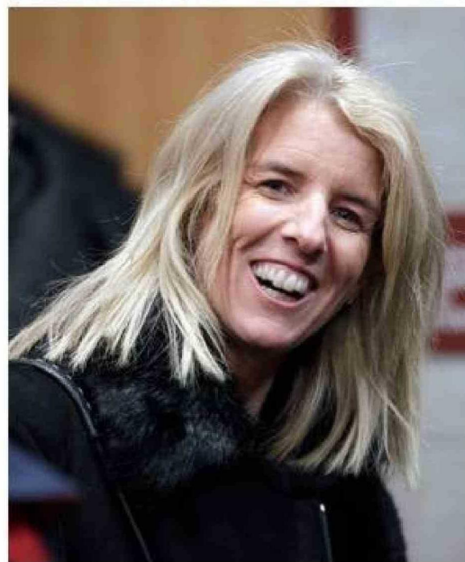
Rory, la menor de los once hijos de Robert Kennedy, en una columna de opinión publicada en el diario The New York Times pidió que el asesino no fuera puesto en libertad.