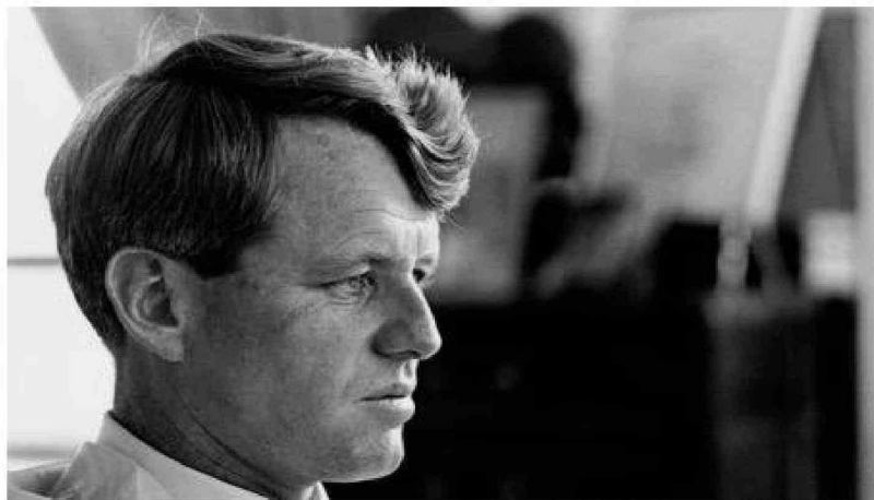
Las evidencias físicas y grabaciones de audio ponen en duda la teoría oficial del “asesino solitario” en el caso Kennedy.

Luego de examinar cientos de interrogatorios y pruebas do-