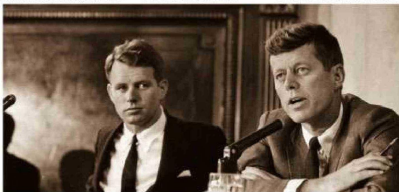
Las investigaciones determinaron que los asesinatos de los hermanos Robert F. Kennedy y John F. Kennedy fueron cometidos por asesinos solitarios.

Esas pruebas desbarataban la teoría oficial del “asesino solitario”, pero Shirhan confesó en el juicio, dio sus razones para matar al senador Kennedy y no mencio-