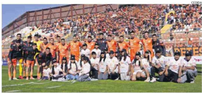
MENORES DE LA COMUNIDAD QUECHUA DE OLLAGÜE COMPARTIERON CON EL PLANTEL DE COBRELOA EN CALAMA.