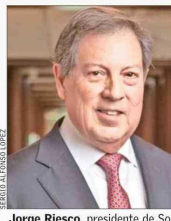
Jorge Riesco , presidente de Sonami.

El presidente de la Sociedad Nacional de Minería (Sonami), Jorge Riesco, valora positivamente la agenda que ha impulsado el Gobierno, y cree que recoge "parte importante de las inquietudes que el sector productivo ha venido planteando respecto de inversión, crecimiento y competitividad". Sin embargo, agrega, "para que Chile pueda realmente capitalizar el actual ciclo de precios del cobre y recuperar dinamismo económico, esperamos que la Cuenta Pública consolide una agenda clara de reactivación estructural y certezas para la inversión". Para lograr eso, cree que hay tres urgencias principales. Dos de ellas están relacionadas, pues cree que, en primer lugar, se debe "avanzar decididamente en la modernización del sistema de permisos y evaluación ambiental, reduciendo la permisología". En la misma línea, remarca que es importante "asegurar la certeza jurídica y la estabilidad regulatoria".