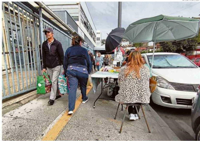
EL ACCESO QUE DA HACIA CALLE SAN IGNACIO ESTA REPLETO DE COMERCIANTES AMBULANTES.

Si bien reconoce que en ocasiones la presencia de vendedores ambulante es un "mal necesario", ya que en horas donde no funciona el comercio formal venden elementos necesarios para los familiares de pacientes que esperan