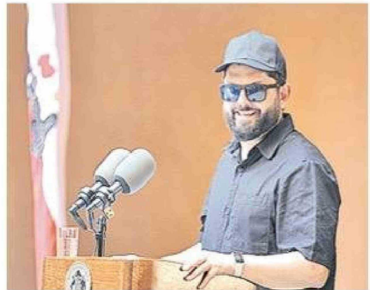
El 29 de enero del presente año, en Copiapó, el entonces Presidente de Chile, Gabriel Boric, inauguró el nuevo Museo Regional de Atacama.

La fiesta se realizó el viernes 9 de enero en el subterráneo del Ca-