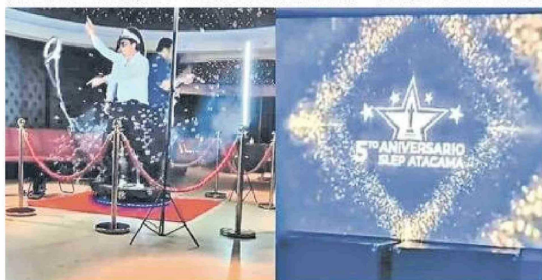
La polémica fiesta del Slep Atacama se realizó en el Casino de Copiapó y cuyos registros audiovisuales se viralizaron en redes sociales.