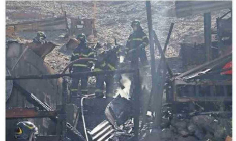
EL INCENDIO FUE CONTROLADO CERCA DE LAS 15:00 HORAS DE AYER.

Cabe señalar que hasta el cierre de esta edición se mantenían voluntarios para indagar las causas del inicio del fuego. La Municipalidad de Copiapó y la Junta de vecinos del sector realizaron las coordinaciones necesarias para prestar ayuda a los damnificados. ☞