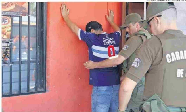
CARABINEROS DE CHILE Y FUNCIONARIOS DE LA DISEM VIGILARON EL PROCESO FISCALIZADOR EN LA FERIA.