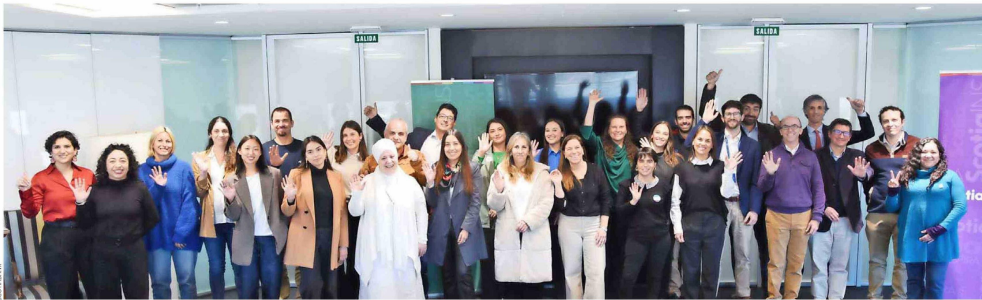
Nueve fundaciones fueron las ganadoras de la quinta versión de los fondos concursables del programa Scotiabank INSPIRA.

Más de un millón de beneficiados, 45 proyectos apoyados y una sola convicción: que el desarrollo sostenible comienza por las personas.