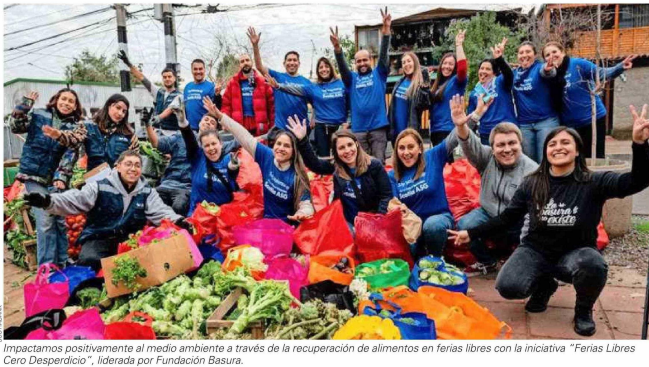
Impactamos positivamente al medio ambiente a través de la recuperación de alimentos en ferias libres con la iniciativa "Ferias Libres Cero Desperdicio", liderada por Fundación Basura.

Más de un millón de beneficiados, 45 proyectos apoyados y una sola convicción: que el desarrollo sostenible comienza por las personas.