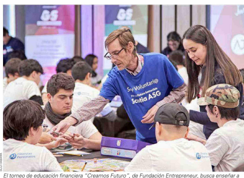
El torneo de educación financiera "Creamos Futuro", de Fundación Entrepreneur, busca enseñar a niños y niñas de forma lúdica, dinámica y simple nociones básicas para un correcto manejo de sus finanzas personales.

MÁS QUE FINANCIAMIENTO: UNA RED DE COLABORACIÓN Scotiabank INSPIRA no solo entrega recursos. También conecta a las fundaciones, voluntarios y redes de