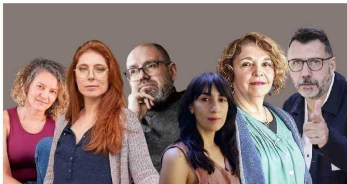
► Diez personalidades del mundo literario chileno confiesan su relación con los libros.

Siempre escribo dedicatorias, pero nunca directamente en las páginas del libro, pues no sabes qué hará esa persona con el ejemplar después. ¿Y si se lo regala a alguien querido? ¿Y si quiere venderlo porque no le