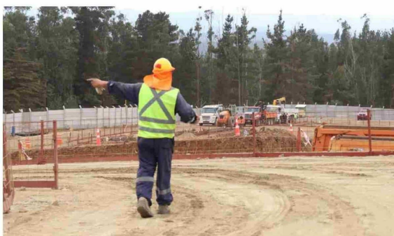
Trabajos de instalación de faenas y empalmes provisorios se ejecutan como parte de las obras iniciales del proyecto concesionado.

Para el anhelado recinto asistencial de la provincia Cardenal Caro ya se ejecutan los primeros trabajos en terreno para un proyecto que entra en una etapa decisiva con el inicio de la construcción estructural del recinto en enero, una inversión estratégica para la salud de la provincia Cardenal Caro.