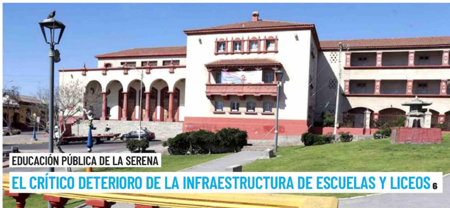
EDUCACIÓN PÚBLICA DE LA SERENA

Pese a las dudas iniciales, la DGAC aprobó y emitió el certificado de aeronavegabilidad necesario para que la aeronave destinada a Carabineros pueda prestar servicios en una serie de operativos como labores de rescate, seguridad y combate al narcotráfico. 5