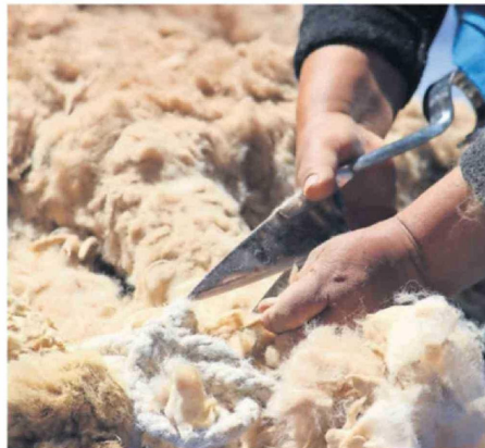
ES UNA DE LAS POCAS ACTIVIDADES QUE PERMITE VIVIR Y PROSPERAR EN TIERRAS SOBRE LOS 3.500 MSNM.

La red de ganaderos y ganaderas está compuesta por asociaciones y comunidades indígenas y jóvenes que han regresado a sus comunas de origen después de formarse, dispuestos a revitalizar su gran legado cultural, desde el año 2021 se encuen-