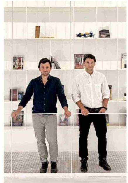
URZÚA SOLER ARQUITECTOS

Han explorado con distintos materiales y lo que les interesa es que estos sean protagonistas, que la estructura se muestre y exprese, "se convierta en la resolución final del proyecto". En muchos casos, el sistema industrializado con madera laminada les ha servido para esto y para ser muy eficientes en la construcción, reduciendo tiempos, desechos y labores de faena. "La gracia es llegar a obras más limpias, simples y precisas, y con un carácter atemporal", agregan. Este camino los llevó a recibir en 2025 la Medalla AOA al Arquitecto Joven Destacado y a representar a Chile en la Bienal de Arquitectura Latinoamericana en Pamplona, entre otras exposiciones. VD