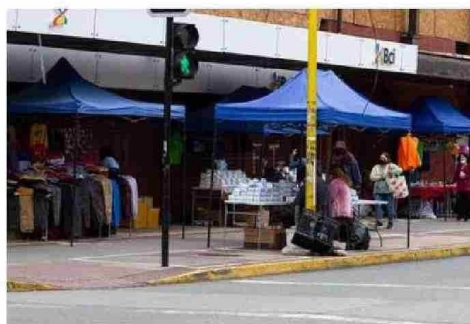
LOS TOLDOS AZULES COPABAN EL CENTRO HACE UN AÑO.