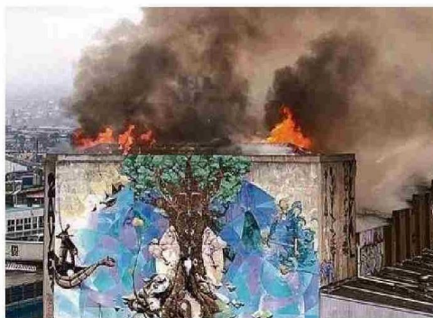
AL INTERIOR SE HALLARON DISTINTAS FOGATAS.

municipio", agregó la alcaldesa (s), quien señaló que aquellas conversaciones seguirán en pie.