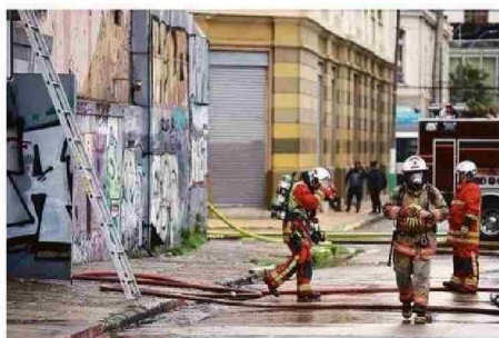
CUERPO DE BOMBEROS LLEGÓ AL LUGAR A ESO DE LAS 10 HORAS.

Más de 100 bomberos combatieron la emergencia en la propiedad deshabitada, ubicada en el Barrio Puerto. Como una crónica anunciada, se presume que el siniestro comenzó por okupas. Dirigentes del sector lo habían advertido.