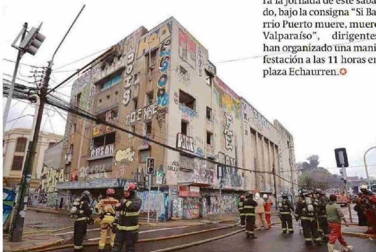
TRANSITO DE AVENIDA ERRÁZURIZ SE VIO AFECTADO, AL IGUAL QUE LA SEMAFORIZACIÓN.

Cabe consignar que para la jornada de este sábado, bajo la consigna "Si Barrio Puerto muere, muere Valparaíso", dirigentes han organizado una manifestación a las 11 horas en plaza Echaurren.