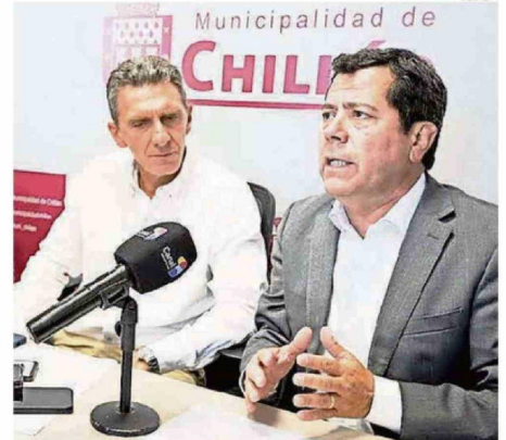
AUTORIDADES COMUNALES SE REFIRIERON A LOS OPERATIVOS.

"Ya sean operativos Puentes, ya sea sacando a la gente que está con construcciones precarias, que son los rucos, valoramos que es la misma ciudadanía la que nos llama y nos pide que intervengamos. Y también con las patrullas mixtas conformadas con Carabineros realizamos controles al comercio ambulante, donde también se han detectado sujetos cometiendo delitos y carabineros han procedido a detenerlos, además de los deteni-