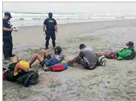
Más de la mitad de los pasos no habilitados a nivel país identificados por Carabineros se contabiliza en regiones del norte del país. Expertos plantean que estos representan solo una parte de las múltiples rutas ilegales.