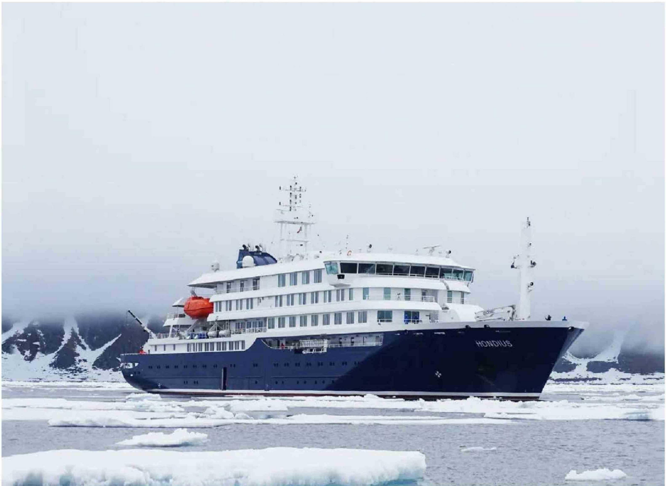
► El crucero holandés MV Hondius, con capacidad para 170 pasajeros y especializado en el Atlántico.