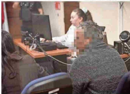
AUDIENCIA SE LLEVÓ A CABO EN LOS LAGOS.

aproximadamente y más de 60 declaraciones forman parte de la investigación que desarrolla la Fiscalía de Los Ríos hace más de un año, en conjunto con policías y otras instituciones.