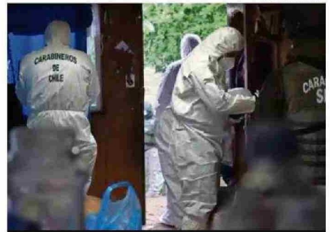
ALLANARON LOS DOMICILIOS DE IMPUTADOS.

se llevará a cabo la audiencia de formalización de cargos en contra de los cuatro imputados por su presunta responsabilidad en la desaparición de Julia Chuñil.