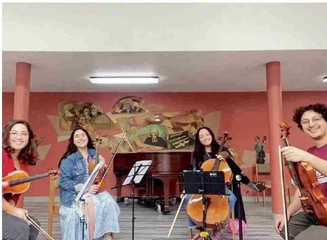
ESTA FOTOGRAFÍA SE LA TOMARON EL SÁBADO EN ESTADOS UNIDOS.