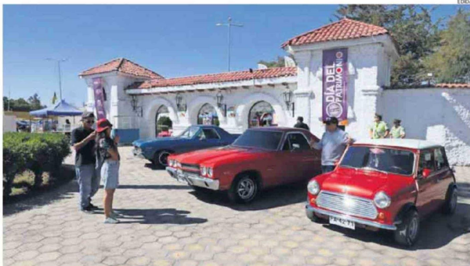
CALAMA Y LAS DEMÁS DE LAS COMUNAS DE LA REGIÓN TIENE PROGRAMADA UNA EXTENSA AGENDA DE ACTIVIDADES PARA CELEBRAR ESTE DÍA.

En la provincia, las jornadas estarán marcadas por iniciativas orientadas a relevar el patrimonio vivo, las tradiciones ancestrales y la memoria local, convocando tanto a residentes como visitantes a participar de actividades gratuitas y abiertas a toda la comunidad.