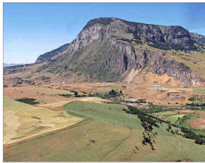
De las 42 millones de hectáreas que administra Bienes Nacionales, 15 millones son de parque nacional y el resto está mayoritariamente en el norte.

dos en concesión a título oneroso, y 1.847 se han dado bajo arriendo.