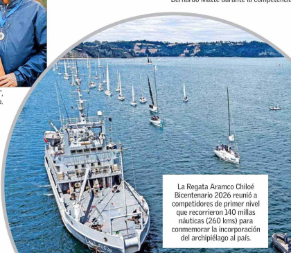
La Regata Aramco Chiloé Bicentenario 2026 reunió a competidores de primer nivel que recorrieron 140 millas náuticas (260 kms) para conmemorar la incorporación del archipiélago al país.