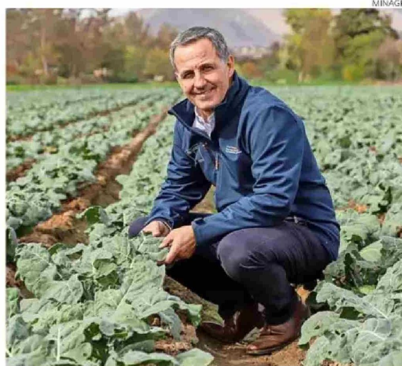
Venezian fue seremi de Agricultura de Valparaíso.