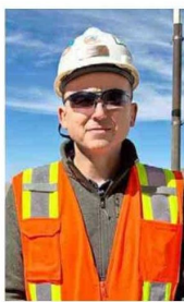
Boris Medina, presidente de Minera El Abra.

Participar en Exponor 2026 es una oportunidad estratégica para nuestra compañía. Esta feria se realiza en el corazón de la minería, lo que la convierte en el escenario ideal para mostrar las innovaciones de la industria, compartir conocimientos y fortalecer vínculos con proveedores de todo el mundo. Estar presentes nos permite proyectar el futuro de la minería, más sustentable y tecnológica".