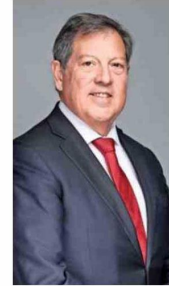
Jorge Riesco, presidente de Sonami.

Para Chile, y particularmente para una región minera como Antofagasta, contar con un espacio como Exponor tiene un enorme valor estratégico. Posiciona al país como un referente mundial en minería y también demuestra la capacidad de nuestra industria para atraer innovación, inversión y talento internacional. Hoy la minería enfrenta transformaciones profundas asociadas a la digitalización, la automatización, la sostenibilidad y la eficiencia operacional. Exponor permite conocer de primera fuente las nuevas tecnologías y tendencias que están marcando el futuro de la industria".