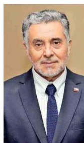
Hugo Briones, subsecretario de Energía.

Exponor es mucho más que una feria minera: es una vitrina del más alto nivel en la cual la energía muestra su valor estratégico para que la minería chilena siga creciendo, innovando y ganando competitividad. Exponor 2026 se está presentando precisamente como un espacio donde la energía y la minería convergen de manera estratégica. Estamos convencidos de que sin energía no hay minería del futuro y de que, sin minería moderna, Chile no puede liderar la nueva economía de la energía".