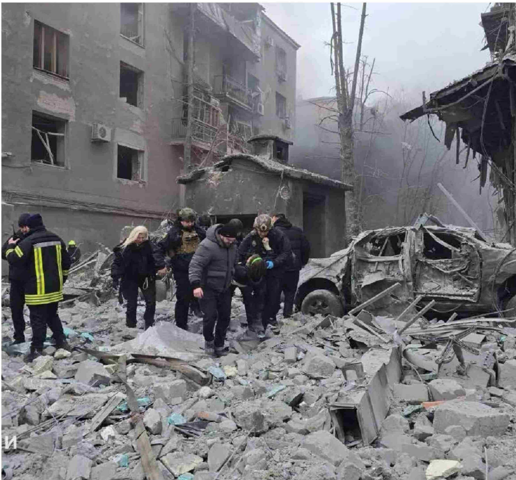
► Ruinas tras ataque ruso en Kharkiv, Ucrania.