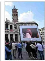
En la basílica Santa María la Mayor, donde está sepultado, y en distintos países se efectuaron homenajes al cumplirse un año del fallecimiento del Papa Francisco. | A 5

"Oscar del deporte" Cómo una ONG chilena que usa el fútbol como herramienta de desarrollo para los niños llegó a ganar prestigioso premio. | A 8